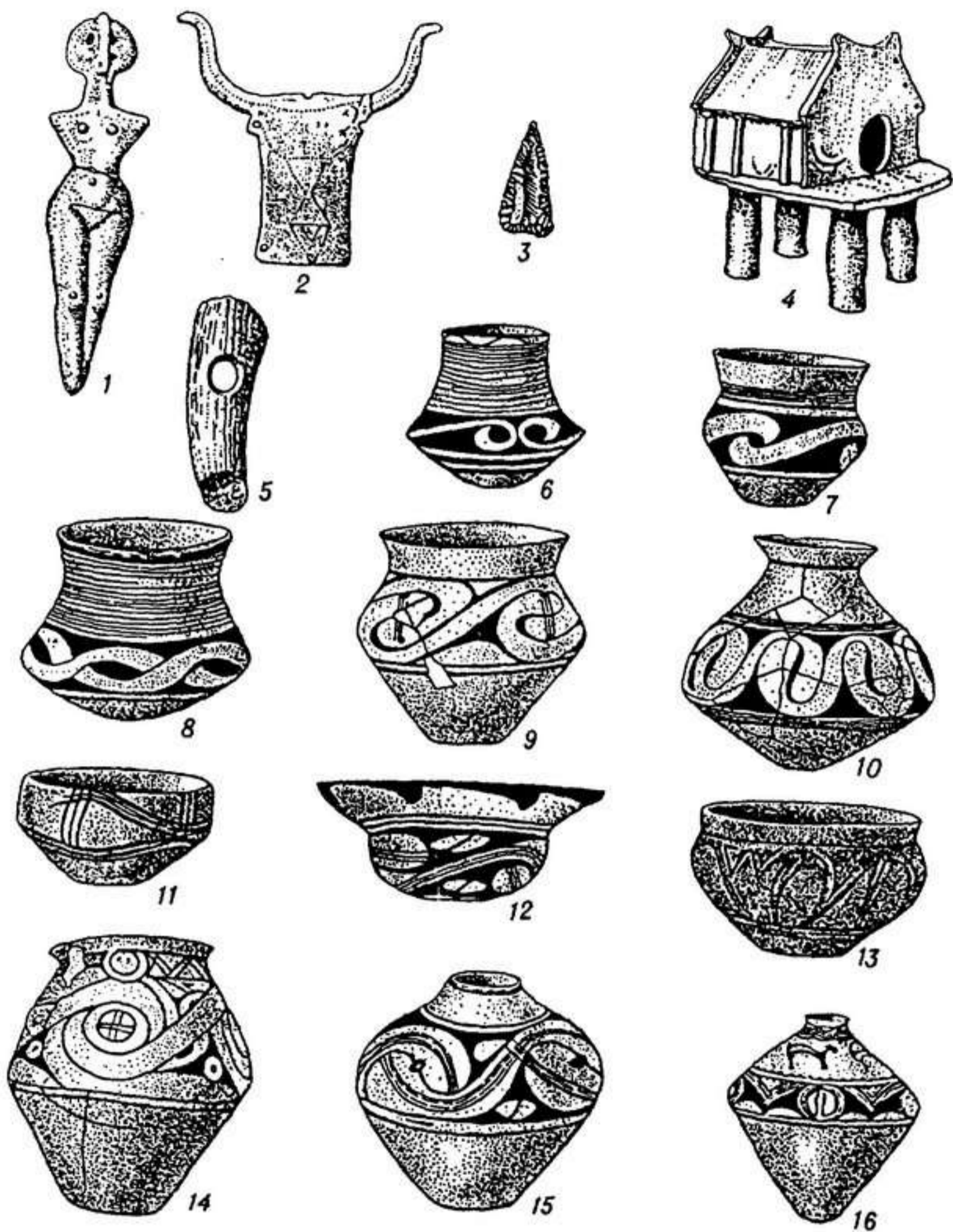
Мал. 34. Трипільська культура V—IV тис. до н. е.: 1 — глиняна статуетка жінки; 2 — зображення бика та жінки; 3 — крем'яний наконечник стріли; 4 — глиняна модель житла; 5 — мотика з рогу оленя; 6—16 — глиняний посуд