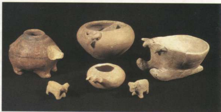
Дрібна пластика трипільської культури (перша половина IV тис. до н. е., с. Тальянки Черкаської обл.).

підкорення сусідніх “номових” або пле-мінних структур. Основою економіки залишається землеробство, навіть мотичне, а значення ремесел у протоміських центрах незначне, воно спрямоване на-самперед на обслуговування верхівки суспільства. Велике поселення-прото-місто є господарським, адміністративно-політичним та культовим центром територіально-поземельної громади, що утворилася внаслідок інтеграції землеробських поселень-громад.