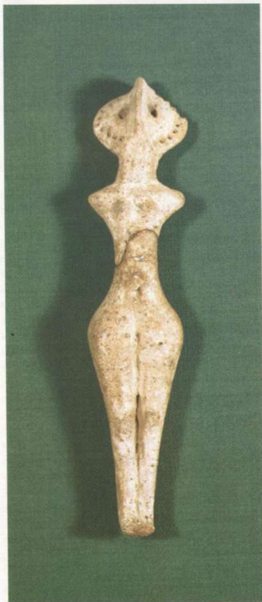
Жіноча статуетка пізнього етапу трипольської культури (кінець IV тис. до н. е., с. Тролянів Житомирської обл.).

різняться за інтер'єром. Останні можуть розглядатися як центри велико-сімейної громади — “великі будинки” 5 . Саме їй могли належати групи з 15—20