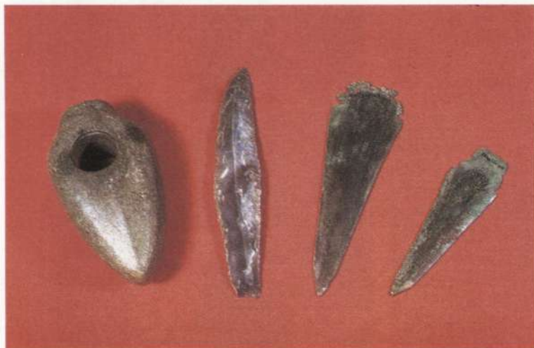
Пізнотрипільські кам'яна сокира і мідні кинджали (початок III тис. до н. е., Червоний хутір, Дарницький р-н Києва).

справи, що сприяло розвитку адміністративної системи. На етапах VII—СІ Трипілля відбувся перехід від територіальної експансії до інтенсифікації освоєння захоплених територій, що зумовило ускладнення відносин між складовими частинами трипільсько-кукутенської спільності, поглиблене відносною нерівномірністю їх розвитку та різними екологічними умовами існування. Системи, що опинилися в центрі цих протиріч (Побужжя, Подністров'я), відзначаються більшою складністю, ніж периферія (Подністров'я).