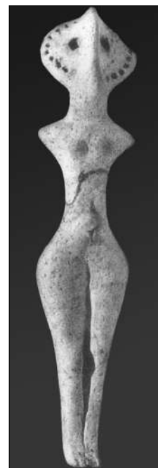
Керамічна жіноча статуетка з пізньотрипільського поселення із с. Троянів Житомирського району Житомирської області.

вали хоч і менш професійно, але за тим самим зразком, що й рад. версію вітчизн. історії. Тож і альтернативний офіц. версії погляд на істор. минуле України конструювали саме за цим зразком. Підґрунтям стали невизнані наукою праці сходознавця А.Кифішина, який прочитав петрогліфи Кам'яної могили та орнамент кераміки к-ри Криш (7—6 тис. до н. е.) як протошумерську писемність. Спираючись на дані А.Кифішина, археолог Ю.Шілов локалізував на території України побіжно згадуване в давньомесопотамських і давньоінд. джерелах місто-державу Аратта, яка насправді за тими самими джерелами розташовувалася на території сучасного Ірану або Афганістану. Незважаючи на той факт, що його висновки заперечує навіть «першовідкривач» укр. Аратти А.Кифішин, Ю.Шілов створив цілісний міф про Аратту як про давню цивілізацію арагтвітрипільців, що стала культурно-цивілізаційним джерелом для давніх шумерської та індоєвропейської цивілізацій. Побудована на засадах первісного комунізму, керована мудрими жерцями-брахманами, Аратта-Трипілля стала вінцем більш ніж 20-тисячолітньої еволюції автохтонного населення Європи. Це нібито була країна величезних багатопо-