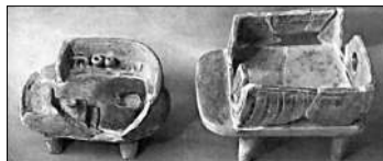
Керамічні моделі трипільських жител, знайдені під час археологічних розкопок поселень трипільської культури.

Т.к. в Україні представлена поселеннями та поховальними пам'ятками (серед яких кургани та ґрунтові могильники), а також скарбами, кременеобробними майстернями. Серед поселень виділяють протоміста — населені пункти площею 100—340 га (Трипілля, Веселий Кут, Миропілля, Володимирівка, Білий Камінь,