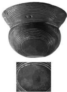
Покришка від грушоподібної посудини. Знайдена під час розкопок В. Хвойки біля с. Трипілля. Зберігається в Національному музеї історії України (м. Київ).

усього на 2012 р. їх налічувалося бл. 2300. Територія поширення: від Прикарпаття на заході до долини Дніпра на сході, у межах лісостепової смуги. Найпізніші пам'ятки виходять у степ — до Пн.-Зх. Причорномор'я. Виділена В.Хвойкою. Отримала назву від пам'ятки, розташованої на пд. зх. від с. Трипілля.