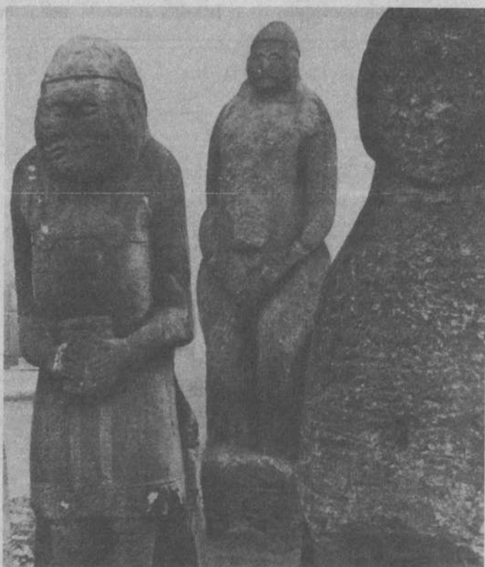
Половецькі кам'яні баби

землі. Деякі з них просувалися вглиб степів, а ті, що жили в долині Дніпра, йшли на північ, у непрохідні ліси Полісся й далі. На 2000 р. до н. е. трипільська культура як виразне ціле перестала існувати. Частину трипільців підкорили й асимілювали войовничі степові племена, решта знайшла захист у північних лісах.