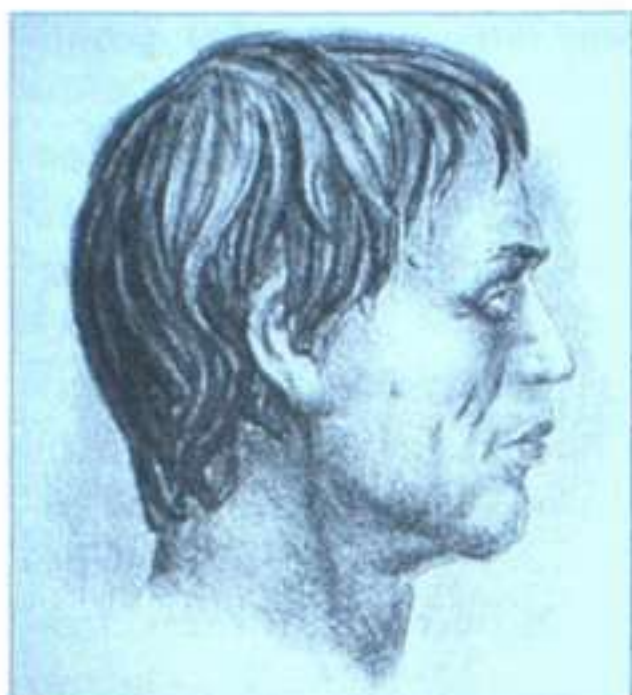
Чоловік із пізньотрипільського могильника поблизу с. Вихватинці. Графічна реконструкція М. Герасимова