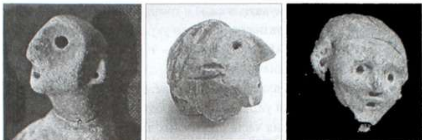
Трипільські антропоморфні статуетки з реалістичними рисами обличчя

відомо близько 50 статуеток з реалістичними, індивідуальними рисами обличчя 21 .