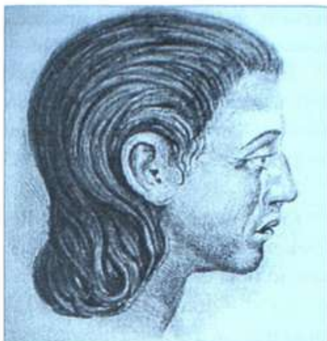
Жінка із пізньотрипільського могильника поблизу с. Вихватинці. Графічна реконструкція М. Герасимова

Узагалі, за комплексом найважливіших краніологічних ознак «вихватинці» належать до південних європеїдів — носіїв західного варіанта давньосередземноморського типу, поширеного в енеолітичну добу серед землеробів і скотарів Балкан та Середньої Європи. Однак до їх складу ввійшов і інший морфологічний компонент — більш масивний, «протоевропеїдний», притаманний багатьом степовим і лісостеповим скотарським племенам Східної Європи. Цікаво, що всі без винятку чоловічі черепи з Вихватинського могильника належать до давньосередземноморського типу, а жіночі тяжіють до «протоевропеїдного» поєднання ознак: перші мають вузьке, а другі — трохи ширше обличчя; перші — доліхокранні, другі — мезокранні, з більшою висотою мозкової коробки. Істотні відмінності спостерігаються також у розмірах довгих трубчастих