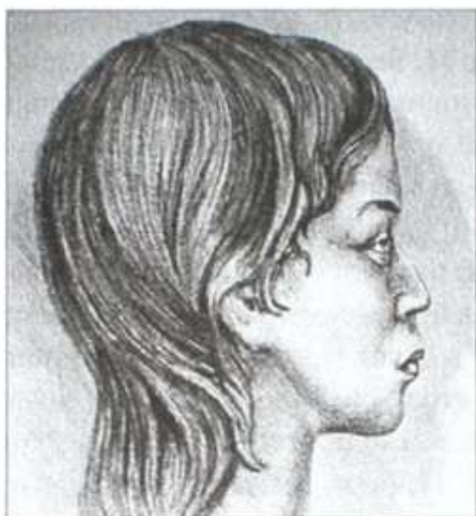
Жінка із пізньотрипільського могильника поблизу с. Вихватинці. Графічна реконструкція М. Герасимова

кісток і загальних показниках фізичного розвитку: чоловіки відзначалися грацильною, а жінки — масивною статуєю. Це дає підстави вважати, що між землеробами-трипільцями та їхніми східними сусідами-скотарями існували не лише тісні господарські зв'язки, а й шлюбні контакти. Хочу, однак, застерегти читача від надмірного перебільшення «питомої ваги» протоевропеїдного компонента в антропологічному складі «вихватинців»: за висновками Великанової, «...він був значно меншим від основного...» і не зміг затушувати південноєвропеїдної антропологічної сутності населення середнього етапу розвитку трипільської культури. За своїми антропологічними характеристиками воно знаходить широкі паралелі серед племен лінійно-стрічкової кераміки Центрально-Східної Європи і людності Великого Середземномор'я