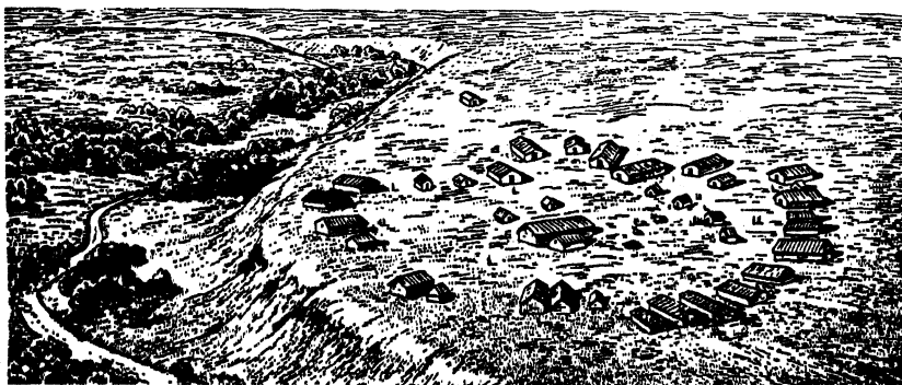
Трипільське поселення (реконструкція)

ми пунктами, своєрідними «протомістами» є Майданецьке, Доброводи, Костенівка, Великий Кут та ін. У них жило 10–20 тис. осіб. Але процес урбанізації не відбувся через періодичні переселення (кожні 50–100 років, як вважають дослідники, у зв'язку з виснаженням ґрунту).