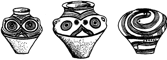
Глиняний посуд з трипільських поселень

слідників вважає, що ці малюнки є піктографією (початком писемності у малюнках).