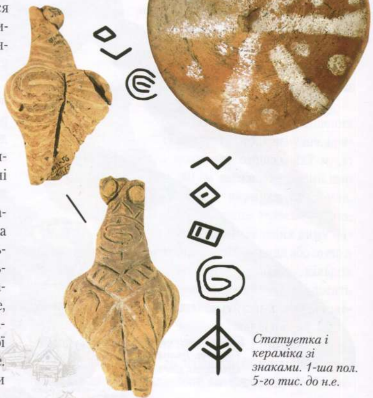
Статуетка і кераміка зі знаками. 1-ша пол. 5-го тис. до н.е.

Дані розкопок свідчать, що приблизно в 2-ій половині 4-го тис. до н.е. налагоджений століттями господарський механізм Трипілля став давати збої. Якщо придивитися до різноманітності варіантів трипільської культури після 3200 р. до н.е., то можна відмітити: різні групи