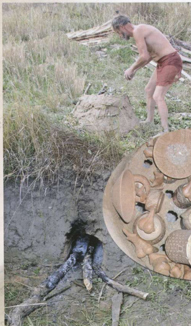
Сучасна реконструкція стародавнього гончарного горна і випалення в ньому "трипільської" кераміки і статуєток

Якщо в трипільські часи існували поселення і окремі майстри, що займа-