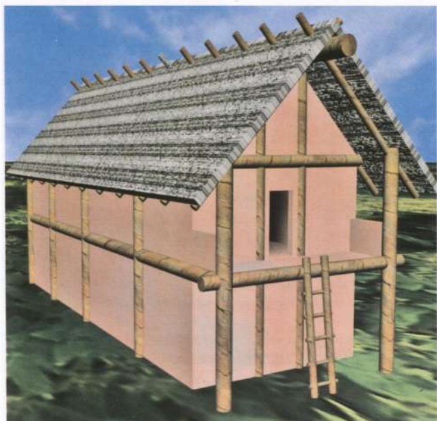
Комп'ютерна реконструкція двоповерхового трипільського будинку