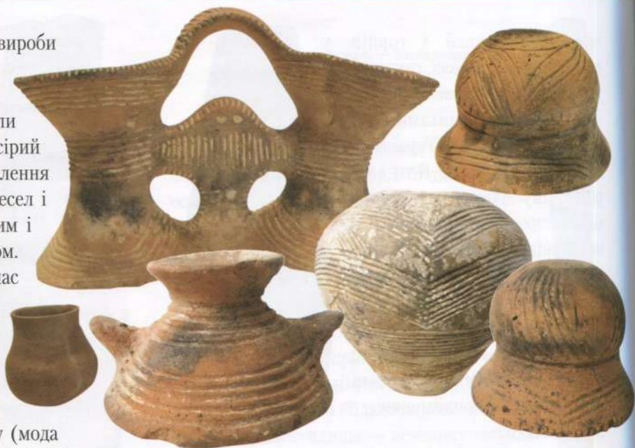
Вироби трипільців Середнього Подніпров'я. 2-а пол. 5-го тис. до н.е.

Ще одним високотехнологічним виробництвом, що вийшло в ту епоху за рамки домашнього господарства, стало гончарство. Були створені десятки різновидів форм посуду (мода на які змінювалася в кожному поколінні майстрів), розроблені склади формувальних мас. Для поліпшення якості виробів використовувалася суміш глини з різних шарів і родовищ. Для нанесення орнаментів