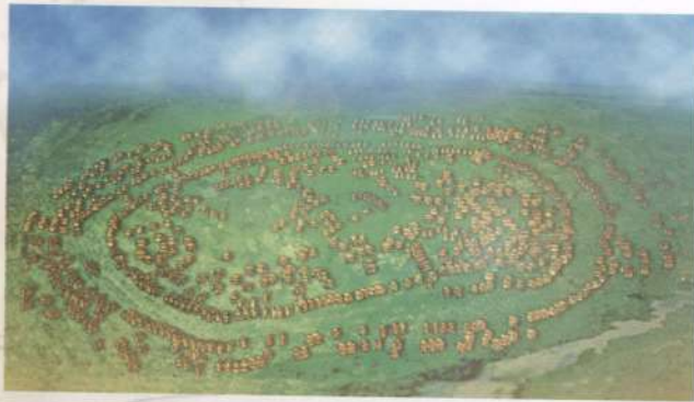
Графічна реконструкція Майданецького — трипільського протоміста площею близько 200 га, за даними розкопок і магнітної зйомки