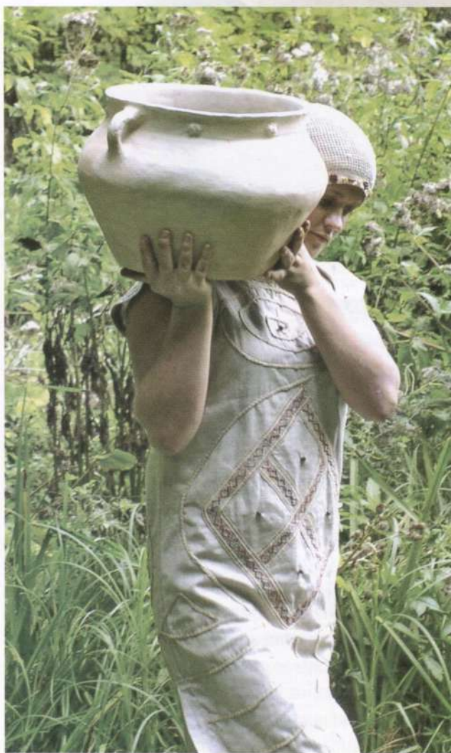
Сучасна реконструкція трипільського одягу і керамічного посуду

інструментів для обробки дерева, у тому числі не лише кам'яних або з кременю, але і мідних.