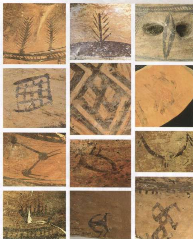
Знаки на розписній кераміці трипільської культури

населення по-різному виходили з кризи, при цьому можна говорити про кілька "антикризових програм", здійснених трипільцями. Не всі з них виявилися вдалим, проте ще років 500–600 ми можемо продовжувати спостерігати трипільський світ.