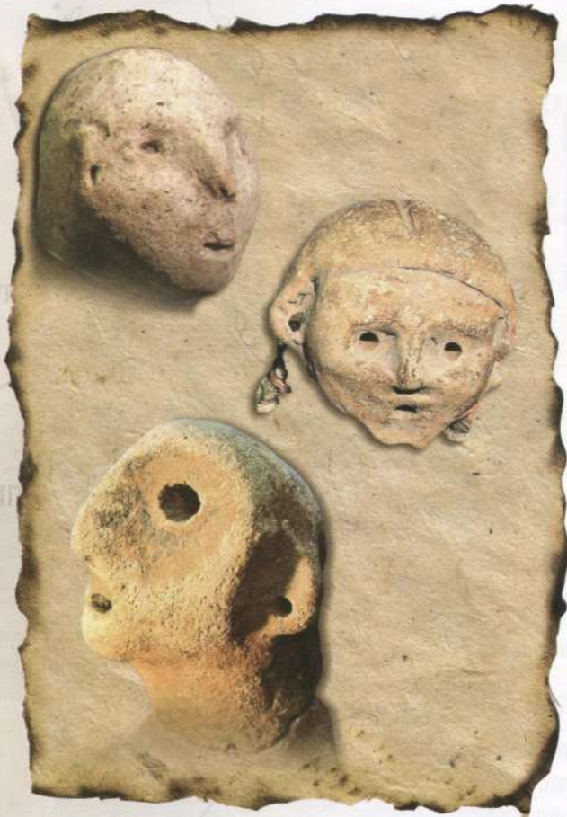
Трипільські "портрети" з межиріччя Південного Бугу і Дніпра. 4-те тис. до н.е.

могильники), у тому числі близько 2300 на території України. Враховуючи тривалість існування (більше 2500 років) і різноманітність локальних варіантів і груп (більше 40), трипільська культура фактично може бути розділена на ряд взаємопов'язаних археологічних культур, за якими, ймовірно, стоять різні етнічні спільноти.