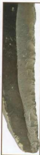
Кременева пластина з зубчастим краєм — стародавній трипільський серп (4 тис. до н.е.)

продуктами одноплемінників, не зайнятих на полях. Ті відпрацьовували свій хліб біля