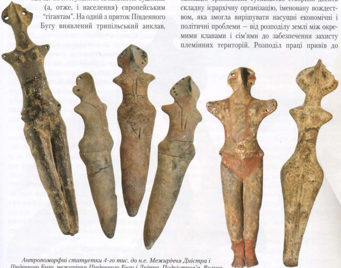
Антропоморфні статуетки 4-го тис. до н.е. Межиріччя Дністра і Південного Бугу, межиріччя Південного Бугу і Дніпра, Подністров’я, Волинь

На прикладі цих поселень-гігантів, протоміст, ми можемо спостерігати початкові стадії процесу урбанізації. Трипільське суспільство створило досить складну ієрархічну організацію, іменовану вождеством, яка змогла вирішувати насущні економічні і політичні проблеми — від розподілу землі між окремими кланами і сім’ями до забезпечення захисту племінних територій. Розподіл праці привів до