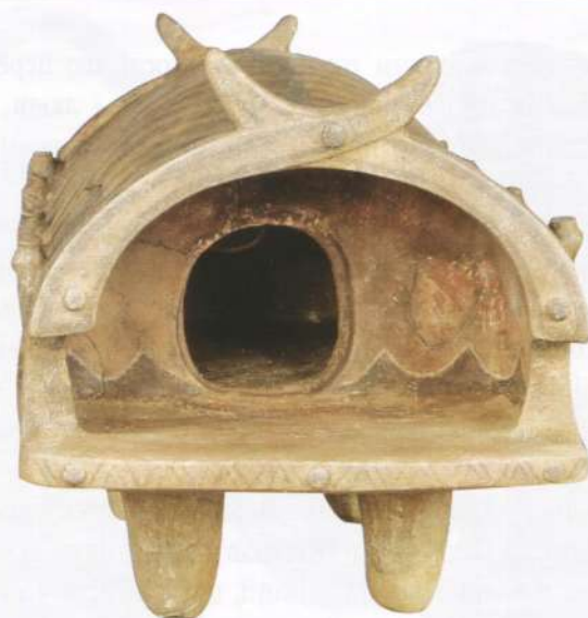
Керамічна модель трипільської споруди демонструє різноманітність форми і декору фасаду — від розпису в кілька фарб до різьблення по дереву. Кінець 5-го — початок 4-го тис. до н.е., межиріччя Південного Бугу і Дніпра

Трипільці чи не першими в цих краях почали будувати великі і, на ті часи, досить комфортні будівлі. Серед трипільських споруд були навіть двоповерхові. Перший поверх, як правило, призначався для господарських потреб, другий був житловим. Мала споруда також горище. Двоповерховий будинок вигідніше одноповерхового ще і тим, що житлове приміщення в ньому вгорі і внизу, крім перекриттів, ізолювано від холоду повітряним прошарком, що покращувало збереження тепла.