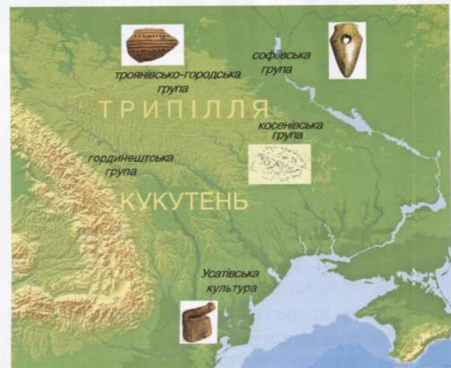
Останні століття трипільського світу: локальні варіанти та культурні типи кінця IV — початку III тис. до н.е.