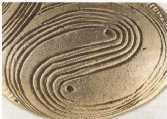
Трипільський прототип символу "їнь і янь": стилізоване зображення пари змії на посудині. 2-а пол. 5-го тис. до н.е., Подніпров'я