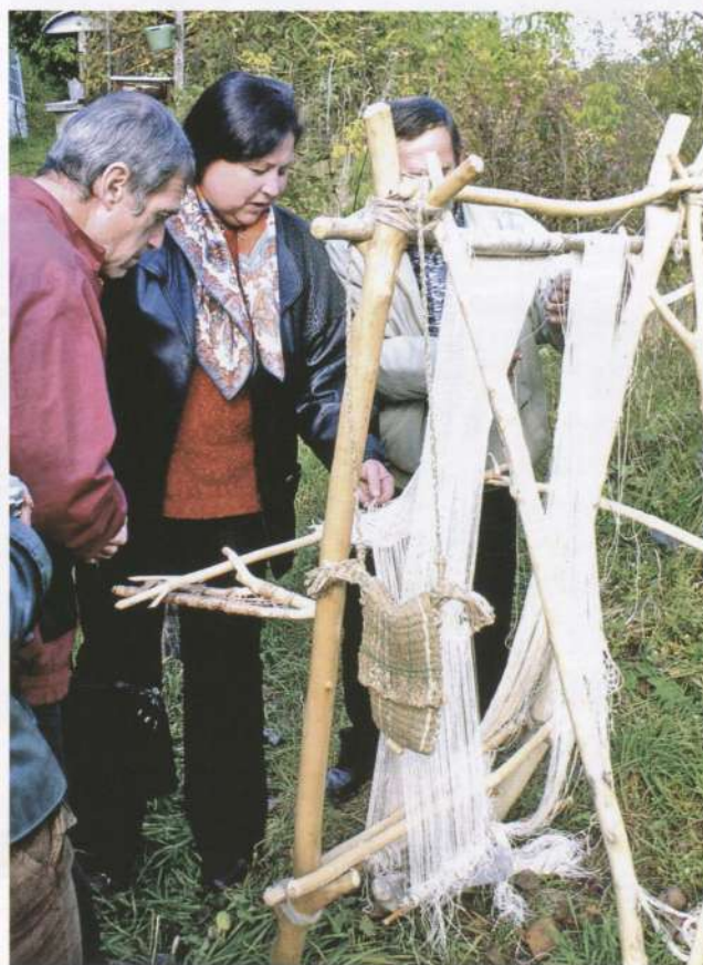
Сучасна реконструкція вертикального ткацького верстата трипільців

Можна прослідити навіть спеціалізацію у видах продукції між окремими регіонами. Вона виникла