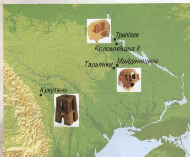
Карта розташування згаданих в тексті поселень культур Трипільля і Кукутень, 4 тис. до н.е.

До моменту появи трипільської археологічної культури в другій половині 6-го тис. до н.е. в Європі землеробство було відоме більше ти-