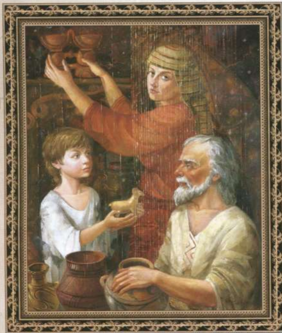
Сучасне уявлення трипільців. Картина "У сім'ї гончара". 2007 р. Художник В. Сліпченко

сячі років, у тому числі і на берегах Дністра, Дніпра, а також на побережжі Азовського моря, але широкого поширення тут цей вид діяльності не отримав. Спроба освоїти багаті землі, зроблена носіями культури лінійно-стрічкової кераміки, обмежилася західними областями України.