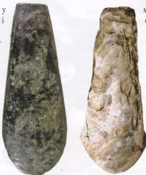
Сокири мідна і кременева: матеріал різний, форма одна. 2 пол. 5-го тис. до н.е

Один їх найбільших центрів кремнієобробки виявлений на Волині в районі села Бодаки. Тут, на річці Горині, виготовляли великі кременеві пластини — довжиною понад 20 см. Щоби відколоти таку пластину від заготовки-нуклеуса, треба було докласти зусилля в сотні кілограм. Вважають, що стародавні