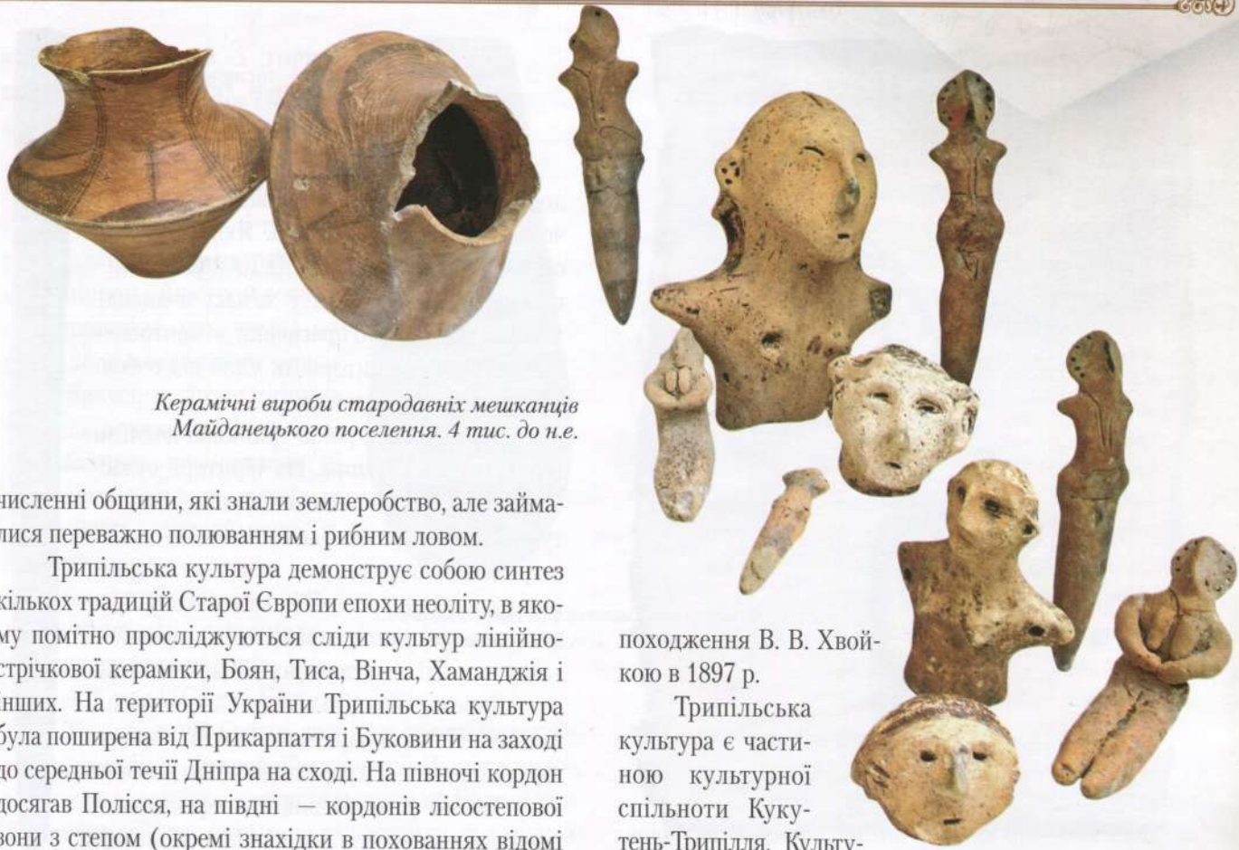
Керамічні вироби стародавніх мешканців Майданецького поселення. 4 тис. до н.е.

численні общини, які знали землеробство, але займалися переважно полюванням і рибним ловом.