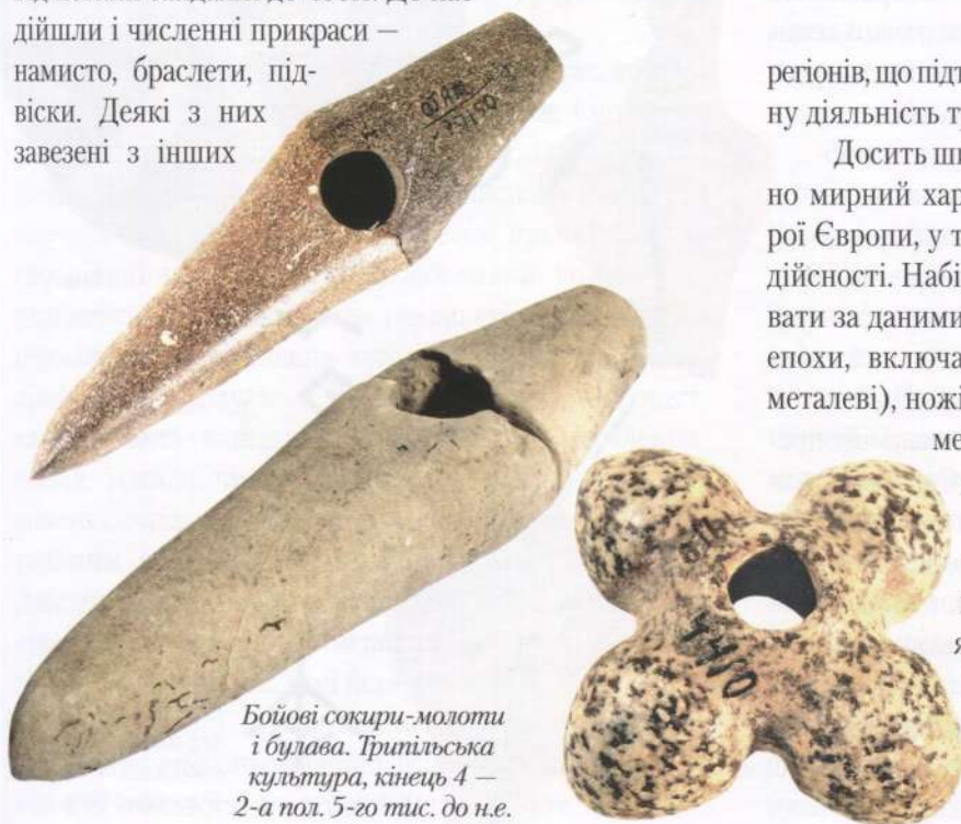
Бойові сокири-молоти і булава. Трипільська культура, кінець 4 — 2-а пол. 5-го тис. до н.е.

Одяг трипільців відрізнявся різноманітністю. Його шили з тканини, прикрашали вишивкою, нашитими кістяними і мідними бляшками. На сьогодні відомо більше двадцяти варіантів крою вбрання і більше десятка різноманітних зачісок. Основним одягом чоловіків була виткана сорочка, на стегнах пов'язка, пишній пояс і перев'язь для зброї. З шкіри шилися жилети, а також добротне і якісне взуття — від легких сандалій до чобіт. До нас дійшли і численні прикраси — намисто, браслети, підвіски. Деякі з них завезені з інших