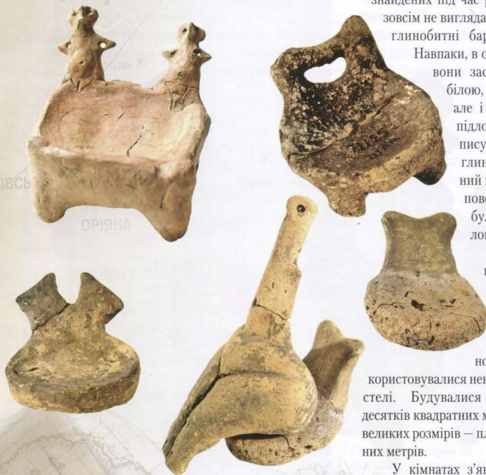
Трипільські меблі — керамічні моделі, виготовлені на початку 5-го — серед. 4-го тис. до н.е.

У кімнатах з'явилися столи і стільці, навіть крісла. Самі вироби до наших днів не дійшли, але відомі їхні керамічні копії, а також дуже багато