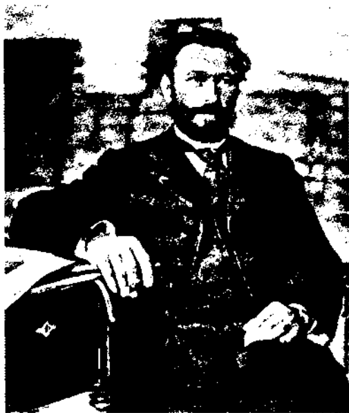
В. В. Хвойка. 90-ті роки XIX ст.

На рахунку В. В. Хвойки-археолога декілька гучних відкриттів — Кирилівська палеолітична стоянка, трипільська культура, за-