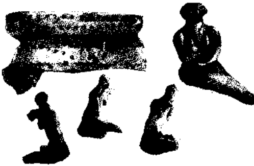
Акварель В. В. Хвойки. Знахідки біля с. Верем'я

кої культури, знахідки цього періоду були відомі (розкопки деяких пам'яток були проведені у 70-ті роки XIX ст. в Галичині, у 80-ті в Румунії; 1892 роком датуються розкопки В. Антоновича на Поділлі), проте вони становили собою розрізнені предмети, які не відносили до залишків життєдіяльності носіїв однієї культури. Місце серед старожитностей Європи та наукове значення цих знахідок не було визначено. Головна заслуга В. В. Хвойки полягала в тому, що він першим зіставив відкриті ним та відомі в різних місцях на території сучасної України археологічні матеріали, виділив їх в особливу тему для наукового дослідження та визначив