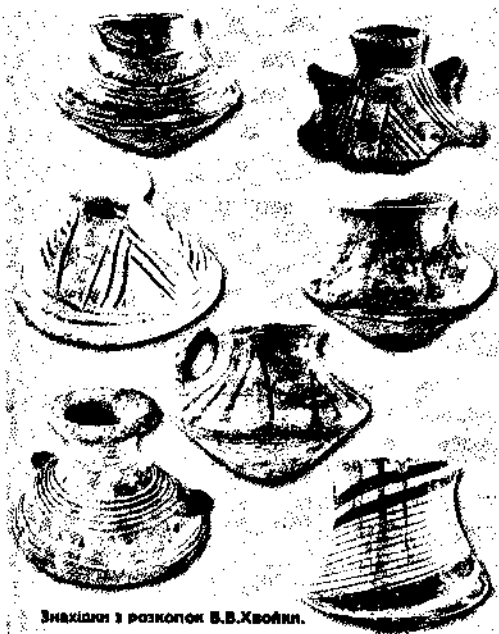
Знахідки з розкопок В.В.Хвойки.

культурою та обрядом поховань” він визнавав в трипільцях “південно-східну частину численного народу, що історично називається слов’янами”. Водночас, відсутність антропологічного матеріалу кам’яної доби не дозволяла йому прийняти як остаточний висновок визнання трипільського населення прямими нащадками їх палеолітичних попередників.