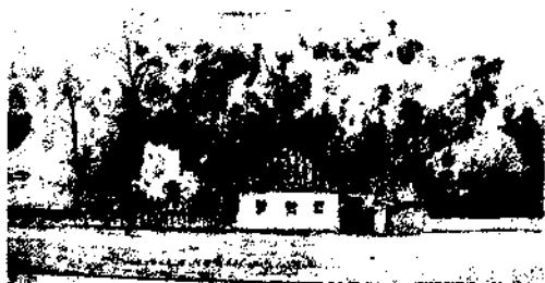
Кирилівська вулиця в Києві. Малюнок В. В. Хвойки. Місце перших трипільських знахідок

На час дослідження В. В. Хвойкою пам'яток, що пізніше отримали назву трипільсь-