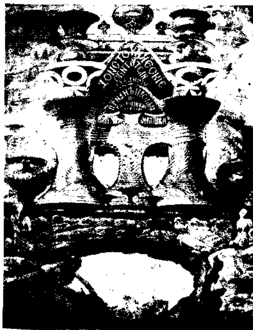
Ескіз обкладинки книги. Малюнок В. В. Хвойки

Отже, одна з головних заслуг В. В. Хвойки (окрім розширення джерелознавчої бази науки) полягала в тому, що він позначив напрями досліджень для наступних поколінь археологів. Він сказав нове слово в археології, накреслив її перспективи, зробив рішучий крок уперед. Ми, дійсно, живемо його спадщиною, працюємо в межах відкритих ним пам’яток і визначених ним культур.