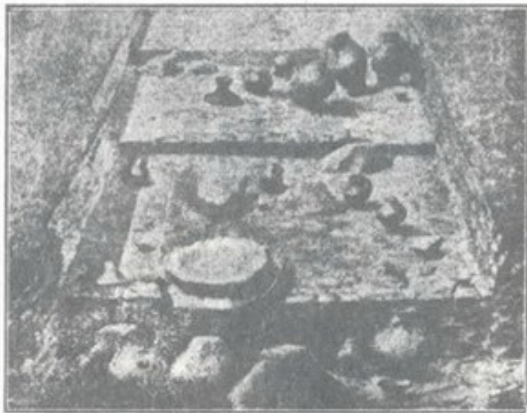
15. Так званий „точок“—останки глиняної хатини-мазанки з ріжною посудою (так званої передмікенської доби), з околиць Трипілля.

Ся новітня кам'яна культура не тягла ся так довго як старша, але слідами її повна майже вся земля наша. Видно, що намножило ся вже людей, тай сліди їх життя стали замітніші, легко їх пізнати, не то що якусь давнішу крем'янку, що й не зміркуеш, чи її рука людська обробила, чи вона сама так одкололась. З сих часів майже скрізь знаходить ся ріжний струмент, посуда глиняна, могили людські, а місцями сліди великих осель: хати, робітні, де виробляв ся всякий струмент, або городища, де ховали ся тодішні люди в небезпечну хвилю; такі городища бувають досить великі—значить і людей коло них жило багато. Покійників своїх ховали часом в камінних скринях зложених з плит, часом в ямах, насипаючи над ними високі могили; иноді закопували цілий труп, иноді палили його на огні і потім попел і недогарки складали в глиняний горщик і закопували; при небіжчику клали часом дещо з його річей і ріжну страву в горнятках.