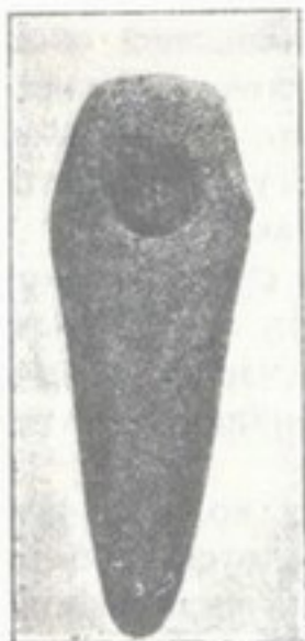
14. Камінна сокіра з недокінченою дірою, з Овруччини (там же).

нійший чоловік не держав домашньої худоби ані звірят домашніх. В часах же новітньої кам'яної культури він уже мав домашню худобу і міг годувати ся мясом і молоком від свого стада. Ще скоріше одомашнив собаку, свого сторожа і вірного приятеля. Навчив ся робити посуду з глини і випалювати її на огні; робив її з руки, без гончарського круга, а проте з часом став виробляти гарні миски й горнята та мережати везерунками. Став робити кращі житла для себе, викопуючи влоговини в землі і надбудовуючи з боків та покриваючи зверху, і так поволі доробив ся досить можливої хатини з дерева чи хворосту, вимашченої глиною. Почав господарити коло землі, сіяти зерно і розтираючи на жорнах пекти хліб або варити кашу.