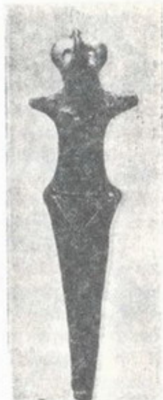
18. Глиняна фігурка людської подоби (звідти ж).

5. Мідь, бронза і залізо. Я вже згадав, що першим металем, яким стали користувати ся люде була мідь, бо її найлекше з руди витопити. Але чиста мідь дуже м'яка і мало здатна на роботу. Люде помітили, що як до неї додати цини (приблизно одну частину цини на дев'ять частей міді), то виходить далеко твердша штука, з якої можна зробити всякий струмент. Така мішанина міді з циною зветь ся бронза 1) . В де-которих сторонах її уживали на всяке знаряде, зброю, струмент дуже довго, з яких тисячу літ, доки не знали заліза.