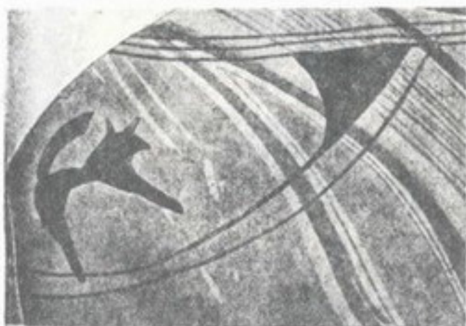
17. Черепок глиняної посудини з малюнком собаки, з галицьких нахідок (Більче Золоте) в музеї Наук. Тов. ім. Шевченка.

Такі оселі йдуть від Дніпра, з під Київа через Київщину на Поділе, в Галиччину і далі на Волощину (Молдаву) і в Балканські сторони; їх звать в науці передмікенськими.